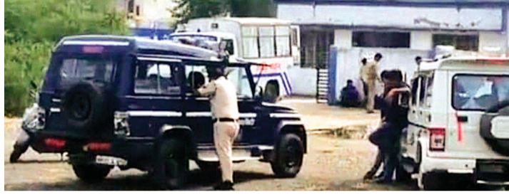
हरिभूमि न्यूज ॥ ब्यावरा

थाना प्रभारी बोले - जुलाई में जारी हुआ था बंटी का वारंट, शुक्रवार को होनी थी आरोपी की पेशी