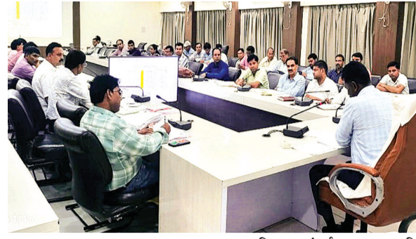
हरिभूमि न्यूज ॥ राजगढ़

जल संचय, जनभागीदारी अभियान में लापरवाही पर हुई कार्रवाई